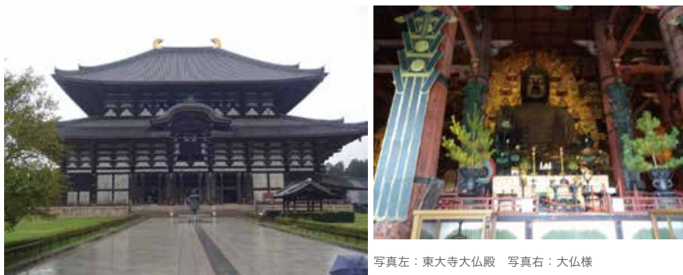
写真左：東大寺大仏殿 写真右：大仏様

今回30年ぶりに京都・奈良を訪ねて、中国の寺院建築が石組みと木組みの組み合わせなのに対し日本の寺院建築は基礎以外は全て木組みで造られていることを改めて、きずかされました。