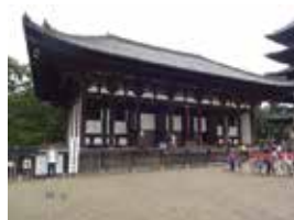
写真上：金閣寺 写真中：仁和寺 二王門 写真下：興福寺 東金堂

仁和寺の仁王門、今回の寺院の門の中で断トツのスケール感、明治維新まで皇子皇孫が門跡となっていたことからも格式が感じられる。