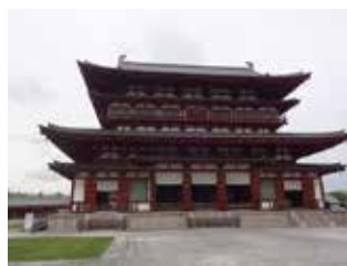
写真左：薬師寺 金堂 写真右：薬師寺 西塔

東大寺大仏殿を観ていると国家の建設と一般大衆をここに集結させる、エネルギーを感じ取ることができます。現代の我々が見ても感嘆するのですから1200年前の人の気持ちはどんな感じだったのでしょうか。